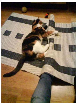
En av mina favorit lekar.