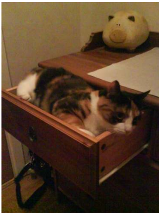
Alla lådor måste provas.