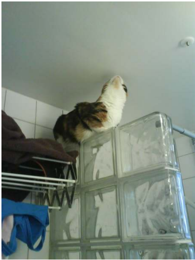
Här har jag inte varit förut. Hoppa upp via tvättmaskinen. När jag ville gå på duschraperistången stoppa matte mig..