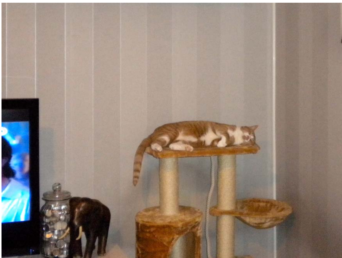
Skönt med vila.