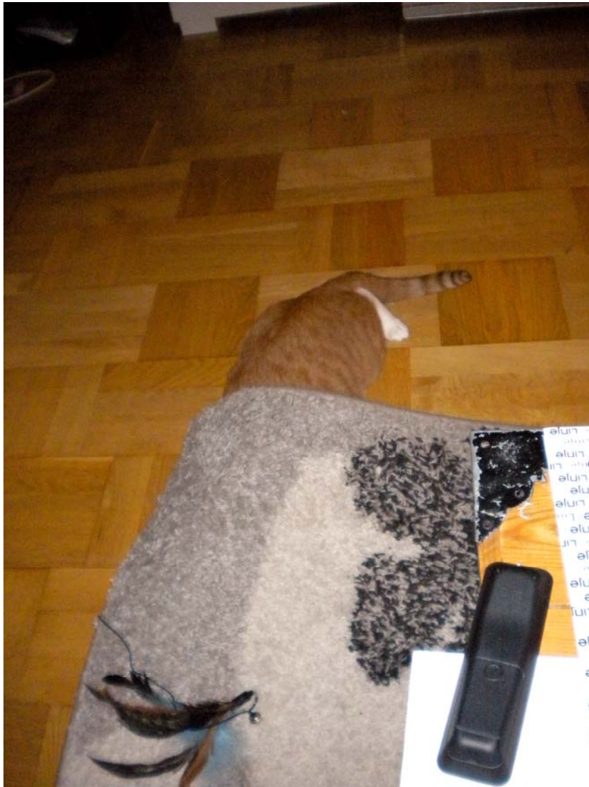
Hittade något kul under mattan.